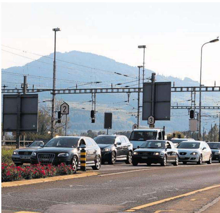
Soll man dem Verkehr auf dem Seedamm mit einem gigantischen Tunnel zu Leibe rücken?