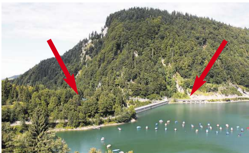
Nur der Staudamm liegt zwischen dem geplanten Asylzentrum (Pfeil links) und der Bushaltestelle (Pfeil rechts).